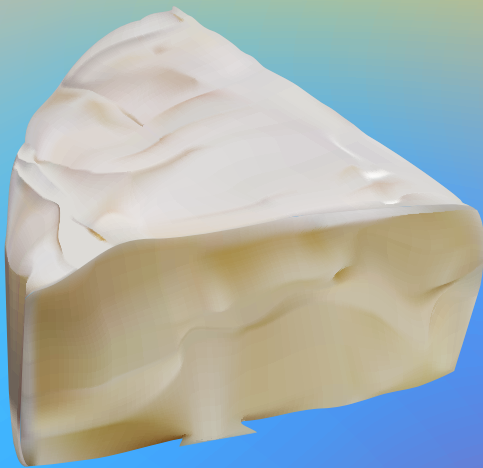
カマンベールチーズ ( 白カビ )